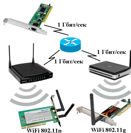
Рис. 1. Структура сети

В результате второго эксперимента было выяснено, что для передачи файла размером 100 Мбайт в беспроводной сети стандарта IEEE 802.11n требуется около 12 секунд. Для сравнения, в беспроводной сети стандарта IEEE 802.11g для этого потребуется около минуты.