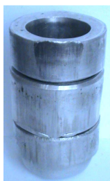
Рис. 3. Комплект втулок получаемых в процессе сквозной прошивки

Проведен эксперимент по прошивке трех заготовок с плоскими торцами, вследствие которого были подтверждены результаты математического расчета с помощью МКЭ (рис. 3). Было установлено, что внутренние слои втулки интенсивнее увлекаются пуансоном, чем наружные. В результате такого деформирования образовывается дефект утяжина (рис. 4).