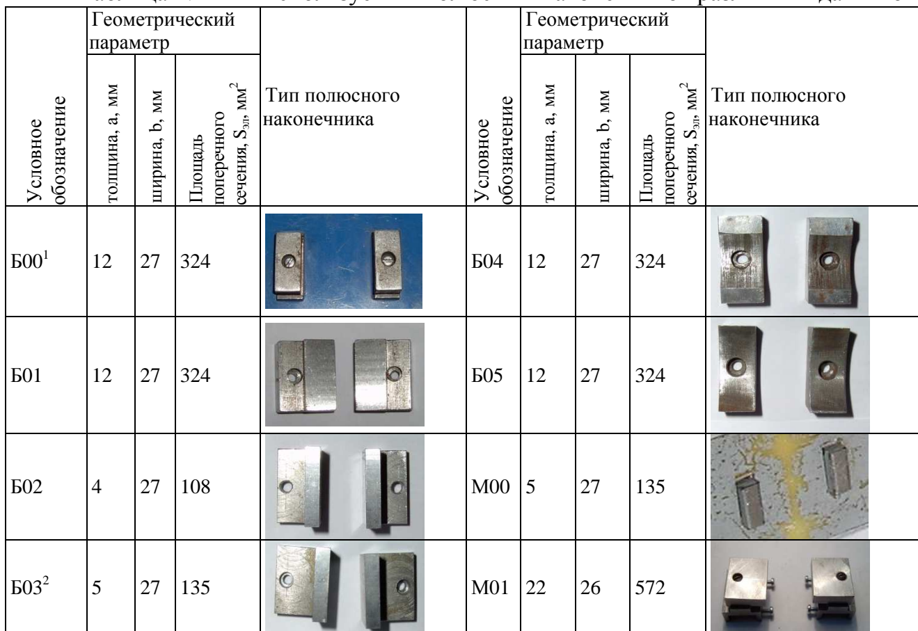
Таблица 1. Типы используемых полюсных наконечников различных датчиков

Примечание. 1 – тип полюсного наконечника аналогичен стандартному накладному преобразователю коэрцитиметра; 2 – увеличено расстояние от катушек до детали, более узкое расстояние между щупами, чем Б02