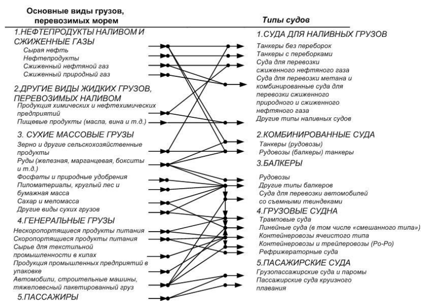
Рис. 1 - Схема тяготения основных видов перевозимых морем грузов к типам судов [2]

Пусть имеется множество X , на котором задано декартово произведение \Gamma \subset X \times X тех пар элементов (x_i, x_j) \in X , которые находятся в отношении R . Обозначим через \mu \in [0,1] множество значений принадлежности членов \Gamma . Тогда нечетким отношением R будет называться упорядоченная пара (x_i, x_j) , для которой функция принадлежности \mu_R(x_i, x_j) имеет положительное значение: