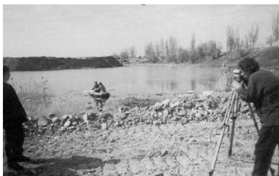
Рис. 1 - Расположение отстойника на полигоне твердых бытовых отходов

В связи с полученными данными, необходимой является нейтрализация загрязнителей осаждением неорганических компонентов и адсорбцией органики. Главной технологической задачей является проведение процесса дезактивации фенолов с использованием доступных, недорогих и нетоксичных компонентов.