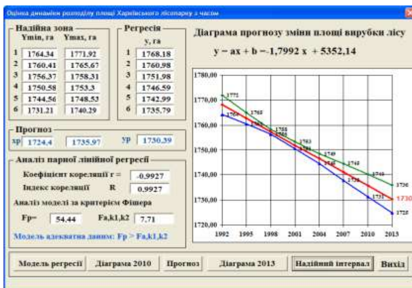
Рис. 2 – Вигляд вікна при натисканні кнопки Прогноз