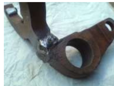
Рис. 2 - Приклади ремонтного зварювання чавунних деталей

В результаті металографічних досліджень и вимірювання твердості основного металу і зони термічного впливу (рис. 3) встановлено, що мікроструктура основного металу типова для сірого ферито-перлітного чавуну. По лінії сплавлення спостерігається смуга шириною 0,2 мм, що має структуру перліт + ледебурит + голки цементиту.