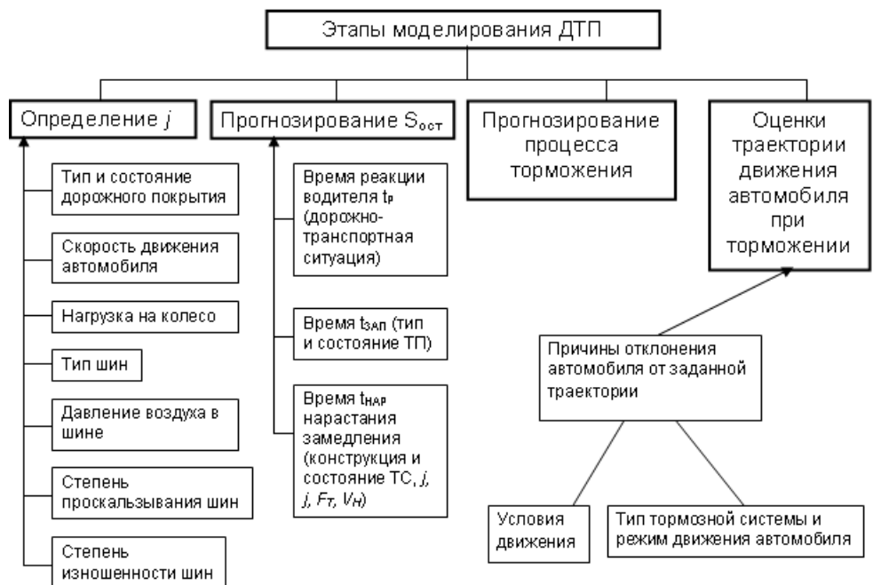
Рис. 1 – Задачи, решаемые при анализе ДТП

После этого моделируется безопасная ситуация и определяются несоответствия моделей, позволяющие установить причины ДТП. В процессе моделирования эксперту необходимо получить ответы по задачам, сформулированным на схеме рис.1.