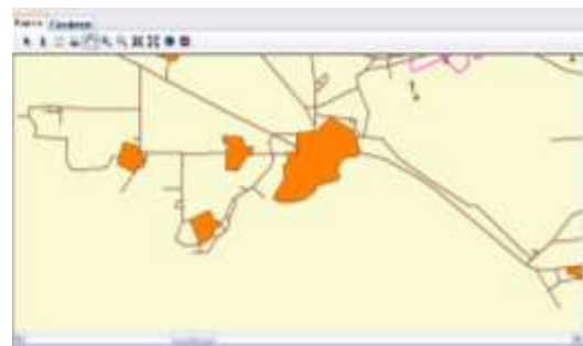
Рис. 3 – Фрагмент вкладки „Проект”, який містить векторні шари і електронну карту моделі

Для формування локальних зон шуму з заданими умовами, як від однієї ВЕУ так і від всієї ВЕС, в комп'ютерній технології були використані R – функції (рис. 5).