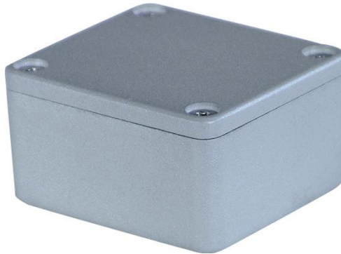
Рис. 1 – Деталь типу коробок

форми типу коробок з постійною і змінною по периметру товщиною стінки (рис. 1).