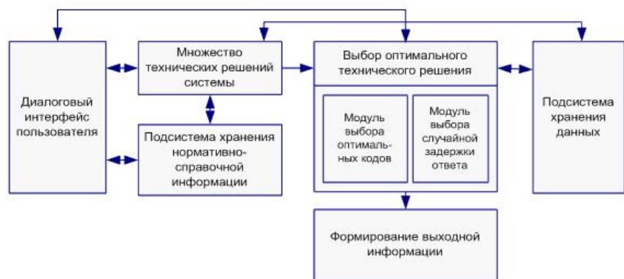
Рис. 1 – Схема взаимодействия программных модулей

параметров системы RFID приведена на рис. 1. Подсистема диалогового интерфейса пользователя позволяет в диалоговом режиме осуществлять корректировку процесса проектирования