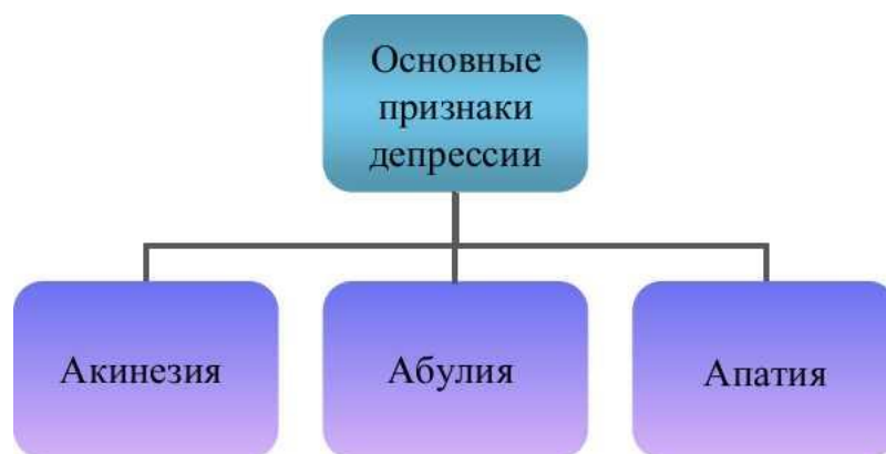
Рис. 1 – Основные признаки депрессии

– акинезию – ослабление двигательной активности, замедленность движений или даже полное нежелание двигаться;