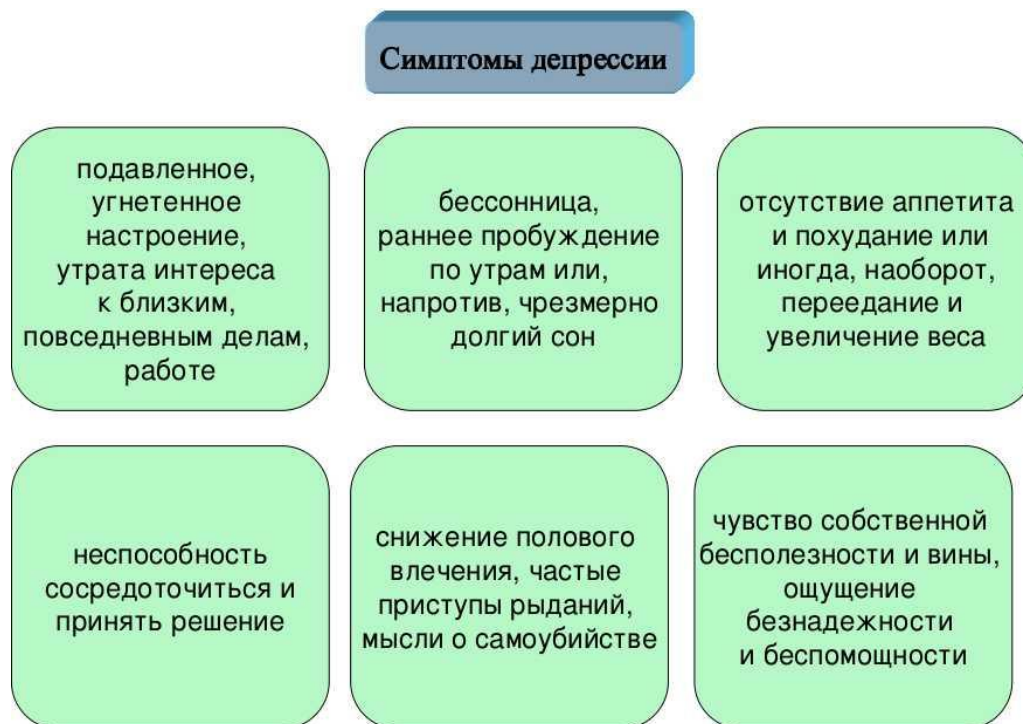
Рис. 2 – Основные симптомы депрессии

психологических и биологических факторов. Последнее время широкое внимание врачей привлекают работы биохимиков по исследованию депрессивных расстройств, где центральная роль отводится нарушениям различных функций гипоталамо-гипофизарно-надпочечниковой системы.