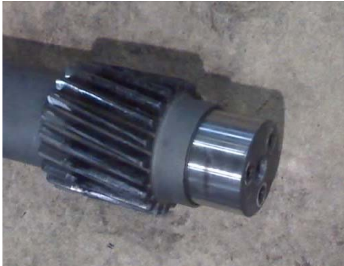
Рисунок 2 – Вид отказа зубчатого колеса

Цели и методы исследований. В исследовании ставилась задача разработки методики нахождения оптимальной термообработки легированной стали для исполнительных механизмов отрезных устройств металлопроката, подвергающихся воздействию комплекса повреждающих процессов постепенного и мгновенного типа. Как показывает опыт, основными причинами выхода из строя зубчатых передач отрезных устройств являются излом зуба у основания и заедание. Отказ зубчатой передачи может иметь двойную природу: усталостное разрушение может развиваться постепенно, или же этот длительный процесс прерывается внезапным статическим разрушением самого зуба или его поверхности. От природы разрушения зависит срок службы передачи. В условиях воздействия на деталь конкурирующих деградиационных процессов выбор механических свойств производится по критерию равенства запасов прочности по усталостному и однократному хрупкому разрушению, когда уже имеется трещина в основании. Но т.к. неизвестно по какой причине произойдет отказ, то критерием оптимизации будет достижение требуемых запасов прочности при максимальной твердости.