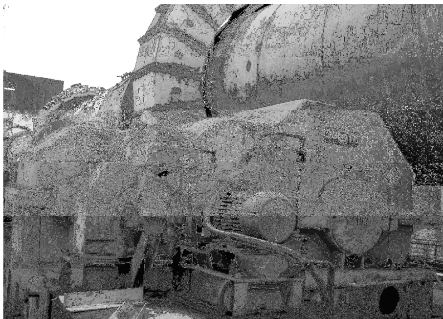
Рисунок 2 – Привод вращающейся печи Ø4,5x170м с редуктором ЦТ-3230

В 2009 году с учетом ряда пожеланий заказчиков разработан технический проект редуктора АС-3500, на тихоходном валу которого крутящий момент составляет 500кН·м при массе 55тонн. Этот редуктор спроектирован взамен редукторов D-3500 и DD-3500. В нем сохранена возможность установки в приводе мельниц Ø2,6x13 без переноса электродвигателя.