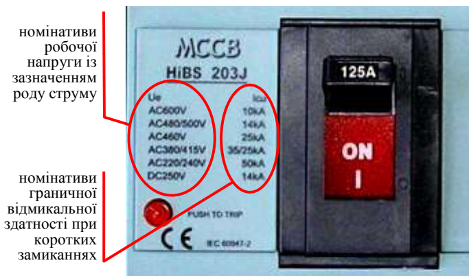
Рис. 4 – Лицьова панель апарату захисту від коротких замикань, на якій виробник розмістив номінативи граничної вимикальної здатності цього апарату при коротких замиканнях ( I_{cn} ) залежно від роду струму (AC / DC) та номінативу робочої напруги ( U_e )

синонімами і в англomовному оригіналі відповідають терміну «ratings», який до речі в оригіналі стандарту, а відтак і у перекладі, не визначений. Для користувача англomовного оригіналу відсутність визначення у стандарті не викликає проблем, бо визначення він знайде в IEC. А як бути читачеві ДСТУ з такою купою невизначених синонімів, якщо читач – не Глеб Жеглов і перед знайомством з ДСТУ досконально не вивчив оригінал? А якщо вивчив оригінал, то навіщо йому недосконалий у змістовому аспекті переклад?