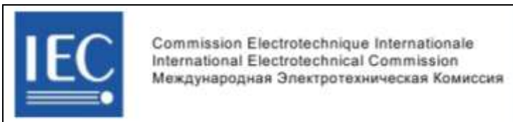
Рис. 2 – Логотип ІЕС

У 70-х роках ХХ століття СРСР домогся визнання російської мови однією з трьох (поряд з французькою та англійською) основних мов ІЕС, в результаті чого російське назва з'явилася на логотипі ІЕС (рис. 2).