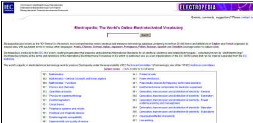
Рис. 3 – Початковий фрагмент оболонки Інтернет-версії IEV

можна побачити, що на цьому ресурсі виставлено вже не 74, а понад 80 частин IEV, проте визначення разом з термінами надаються тільки французькою та англійською мовами, зроблені у попередніх версіях переклади визначень понять на російську мову були геть вилучені, а переклади термінів на російську мову можна знайти лише у деяких частинах, але без визначення понять.