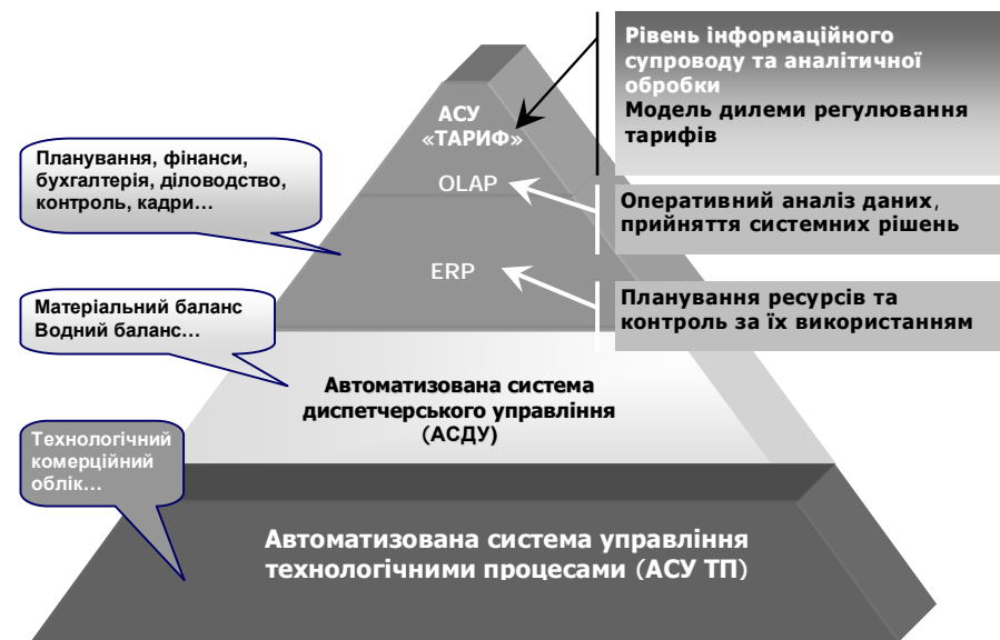
Рис. 1. Комплекс АСУ водопостачанням та водовідведенням

На рис. 1 наведено принципову схему взаємодії компонентів автоматизованої системи управління водопостачанням та водовідведенням.