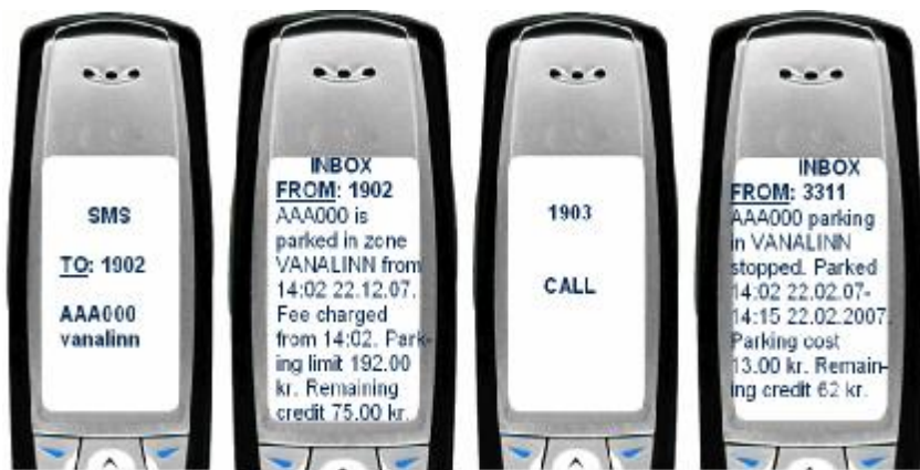
Рисунок 2. Початок (зліва) та закінчення (справа) мобільного паркування

оплати за паркування. Пропонований підхід не потребує значних коштів, базується на наявній техніці як у операторів мобільного зв'язку, так і у населення, а тому може бути швидко та ефективно впроваджений.