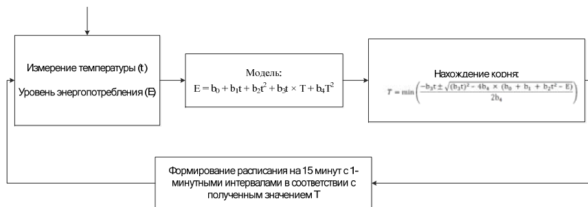
Рис. 3 – Схема формирования расписания работы устройства

Для проведения третьего эксперимента была применена модель энергопотребления, полученная по результатам второго эксперимента. Для управления параметрами работы тепловентилятора был использован разработанный механизм.