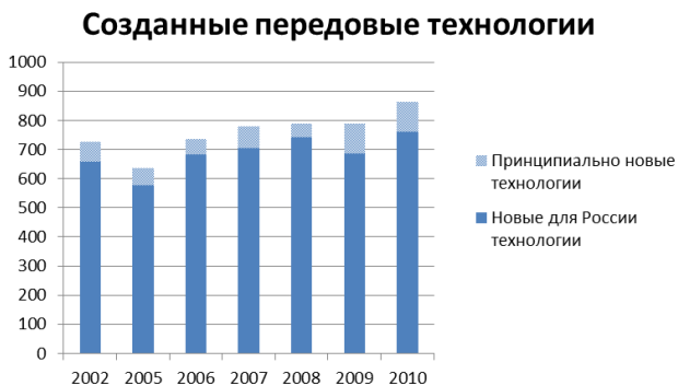
Рис. 1 – Динамика изменения числа передовых разработок

Рост числа публикаций, посвященных перспективным технологиям, рис. 1, вынуждает организации, заинтересованные в получении информации по данной тематике, привлекать значительные трудовые ресурсы на поиск информации в сети Интернет и заполнение баз данных необходимой информацией. Создаваемая система построения отчетов предполагает сокращение использования человеческих ресурсов за счет осуществления выборки информации из Интернета, ее классификации на основе различных критериев и автоматического заполнения баз данных.