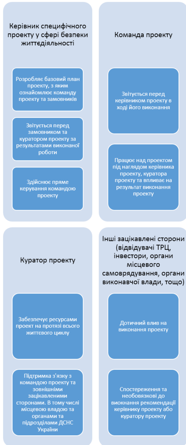
Рис. 2 – Комунікативна цінність в проектах підвищення безпеки експлуатації ТРЦ

інформацією, думками та ідеями між усіма зацікавленими сторонами проекту, для здійснення успішної реалізації проекту та максимальному підвищенню рівня безпеки ОМПЛ. Графічно це зображено на рис. 2.