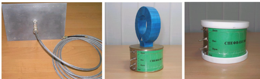
а б в

Рисунок 1 – Средства переноса единиц физических величин: