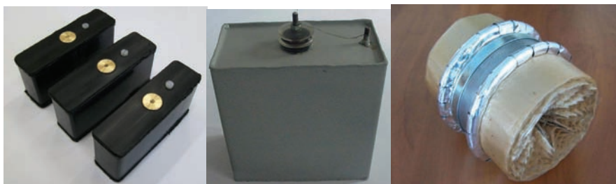
Рисунок 2 –Высоковольтные конденсаторы (слева направо) КИМ-152, КИМ-141, пакет КИМ-153

В НИПКИ «Молния» НТУ «ХПИ» разработаны и созданы 3 типа высоковольтных импульсных конденсаторов для широкополосного импульсного источника питания, разработанного в ООО «Институт электромагнитных исследований» (рис. 1). Характеристики конденсаторов приведены в таблице, а