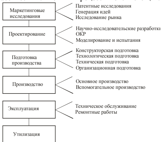
Рисунок 1 – Классическая модель жизненного цикла изделия

В настоящее время при проектировании оборудования в основном используется классический линейный процесс жизненного цикла (рис. 1).