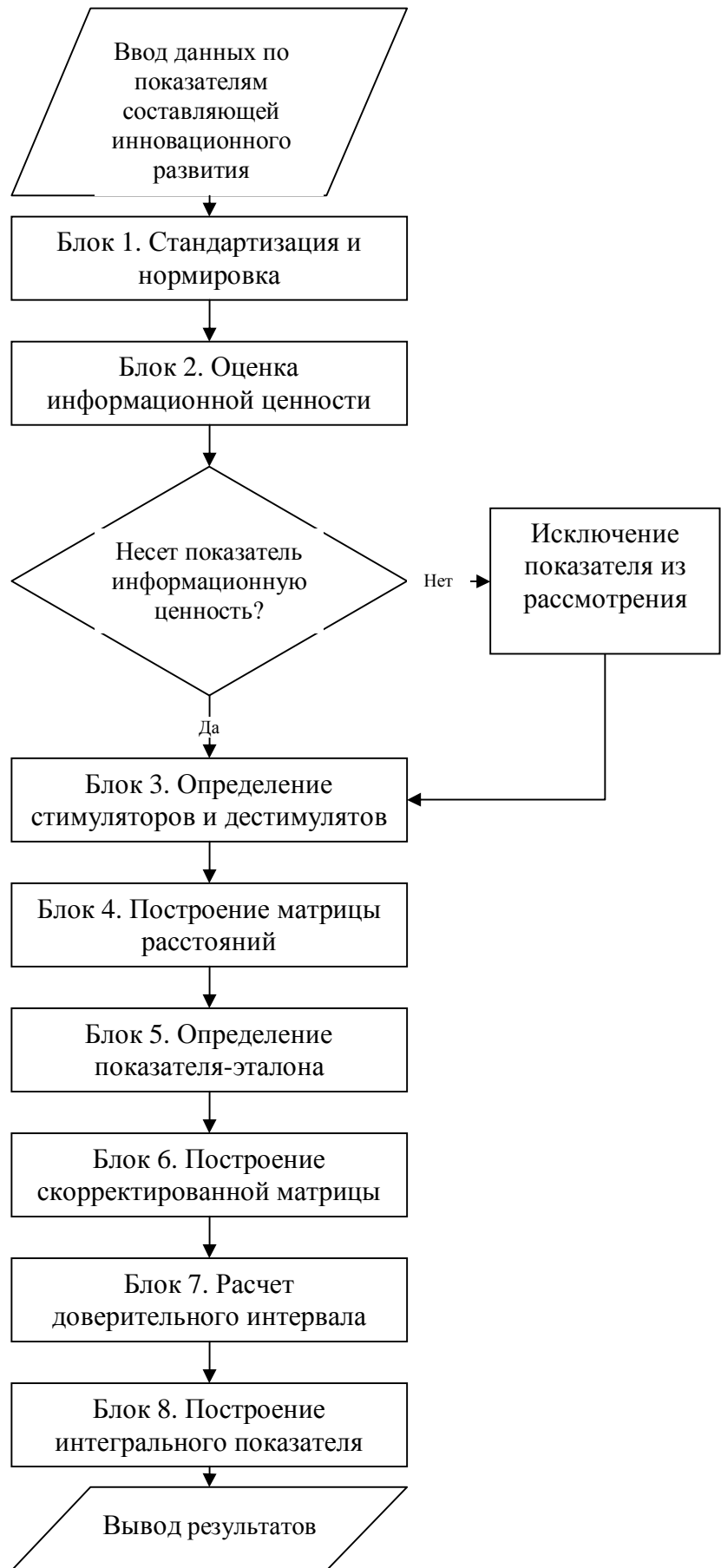
Рис. 3 - Алгоритмическая модель метода уровня развития - стандартизация: