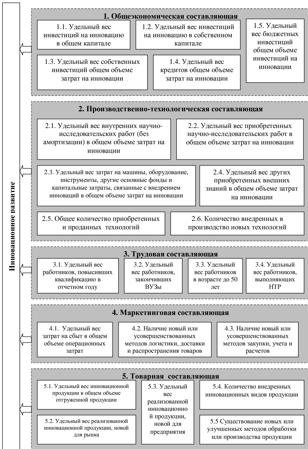
Рис. 2 - Факторы инновационного развития предприятия