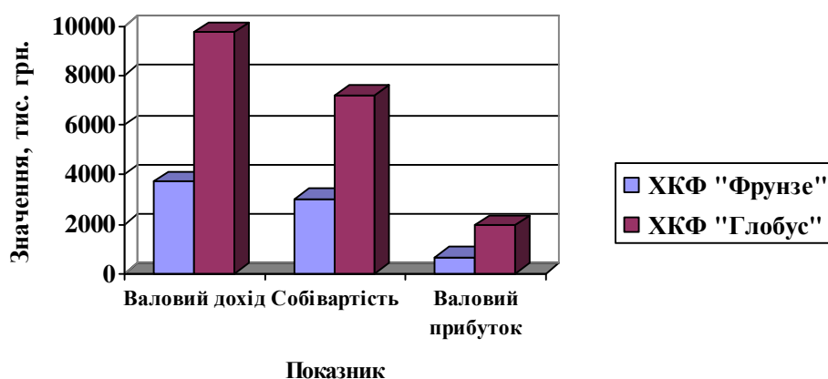
Рис. 2 – порівняння середньоквартальних показників досліджуваних підприємств

Якщо розрахувати такий показник як прибуток на 1 грн. товарної продукції, то отримуємо значення: ХКФ «Фрунзе» - 0,18, ХКФ «Глобус» - 0,2. Цей показник відображає рівень затрат та прибутку у кожній одиниці товарної продукції. Отже, бачимо, що затрати на кожну одиницю продукції обох підприємств приблизно однакові.