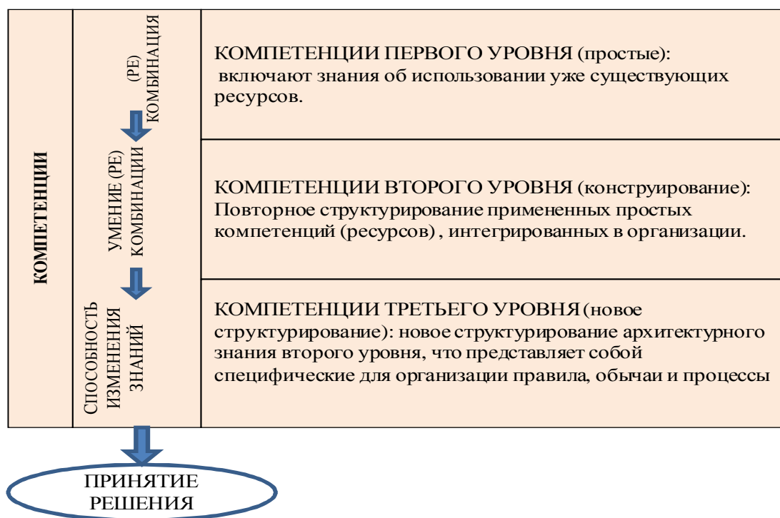
Рис. 2 - Структура компетентности предприятия

Согласно доминантной теории бизнес стратегии (Портера) предприятия должны свои стратегии согласовывать прежде всего с требованиями среды. Согласно данной теории добиться результата выше среднего может тот, кто создает более высокое соответствие требованиям среды, чем его конкуренты, и чем больше он способен на реактивную, преактивную адаптацию. Согласно представлению, которое появилось в 1980-е годы, первоосновой стратегий, создающих стоимость, являются ресурсы и способности организаций. Так, на почве теории предприятия, в основу которой положены ресурсы, на сегодня в процессе формирования находится понимание стратегии на основе ресурсов, или же на основе способности. Согласно данной теории, предприятия располагают различными количествами ресурсов и способностей, мобильность которых между организациями ограничена, однако стратегическое применение во временной плоскости может развиваться до основополагающих способностей, которые дают преимущества по сравнению с конкурентами. Таким образом, можно сказать, что при таком подходе основополагающие способности определяют, какой именно стратегии нужно придерживаться отдельному предприятию для того, чтобы добиться эффективности выше средней. Эти два подхода следует понимать согласно специальной литературе, как две взаимоисключающие альтернативы, на мой взгляд, это два подхода, взаимно дополняющие друг друга, возможность применения которых, в любом случае, зависит от конкурентной позиции и от величины организации, в то же