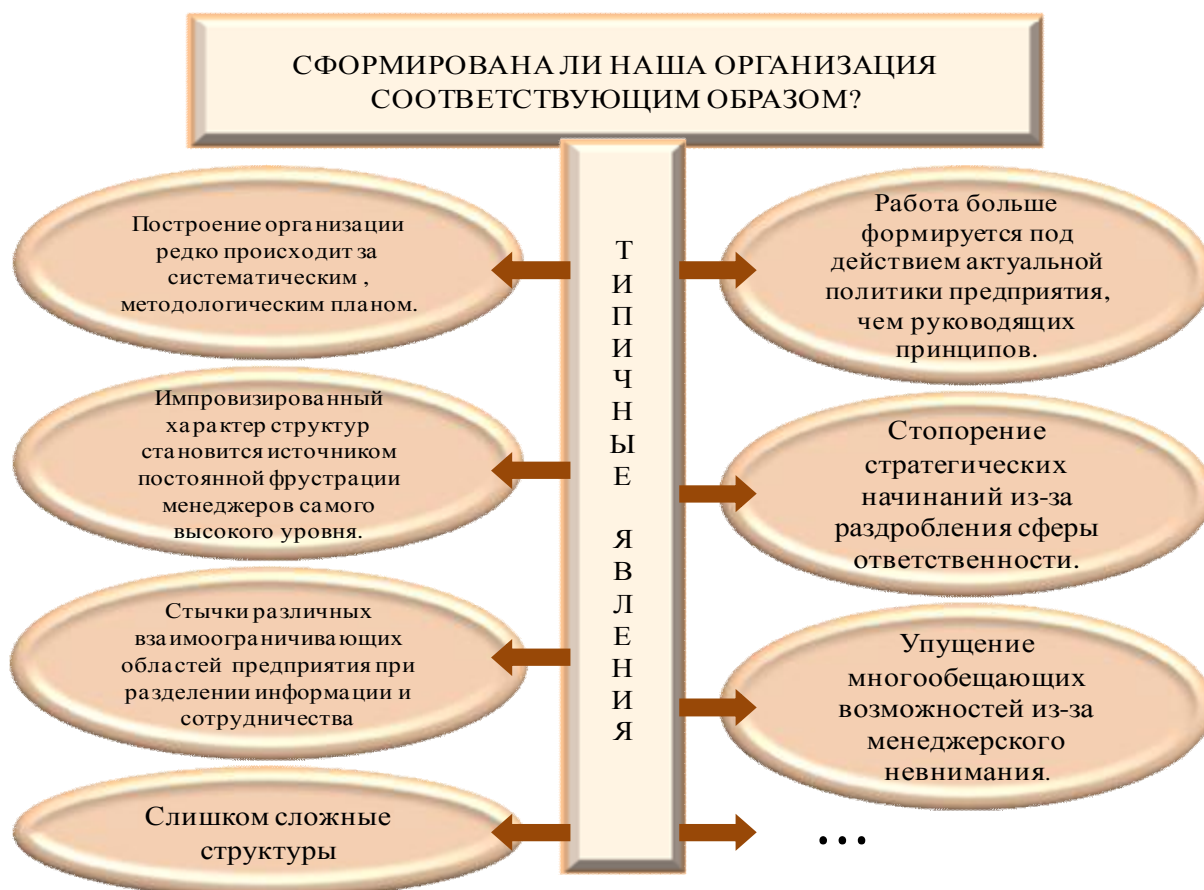
Рис. 5 - Факторы, ограничивающие соответствие организационной структуры

На рис. 5 обобщены типичные факторы ограничения соответствия структуры.