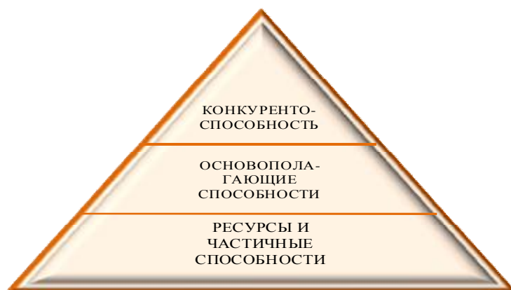
Рис. 3 - Иерархическая структура способностей [6].

Однако нематериальные ресурсы менее очевидны и менее поддаются исчислению, измерению, поэтому и для конкурентов представляется более проблематичным их «копирование», «подражание» им. Отсюда вытекает, что в задачи руководства входит идентификация и распределение ресурсов по группам, а также измерение (оценка, установление) состояния этих ресурсов, в процессе сравнения с конкурентами. Систематическое выполнение данного сравнительного анализа делает возможным определение (уровня) способностей. Способности, исходя из их функциональной области и двигаясь в направлении сотрудничества на предприятии, становятся все более комплексными, многосложными, все более приобретая социальный характер, становясь все более непостижимыми. Способности располагаются друг над другом, менее сложные частичные способности создают такую основополагающую способность, которая способна отличить предприятие от конкурентов, и которая также приводит к конкурентоспособности предприятия (рис. 3).