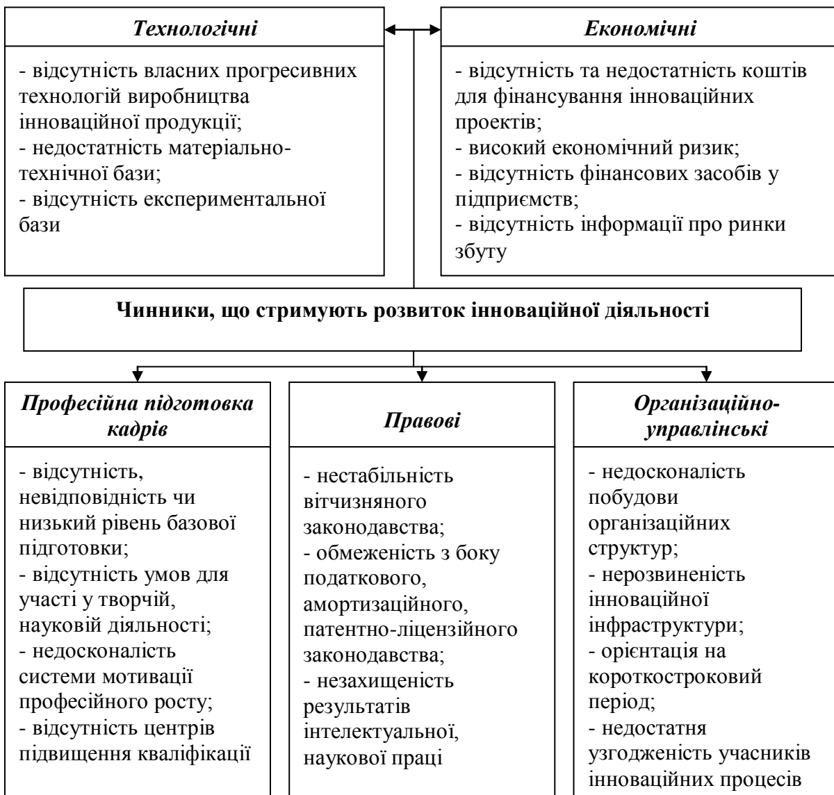
Рис. 2 – Чинники, що стримують інноваційний розвиток підприємств