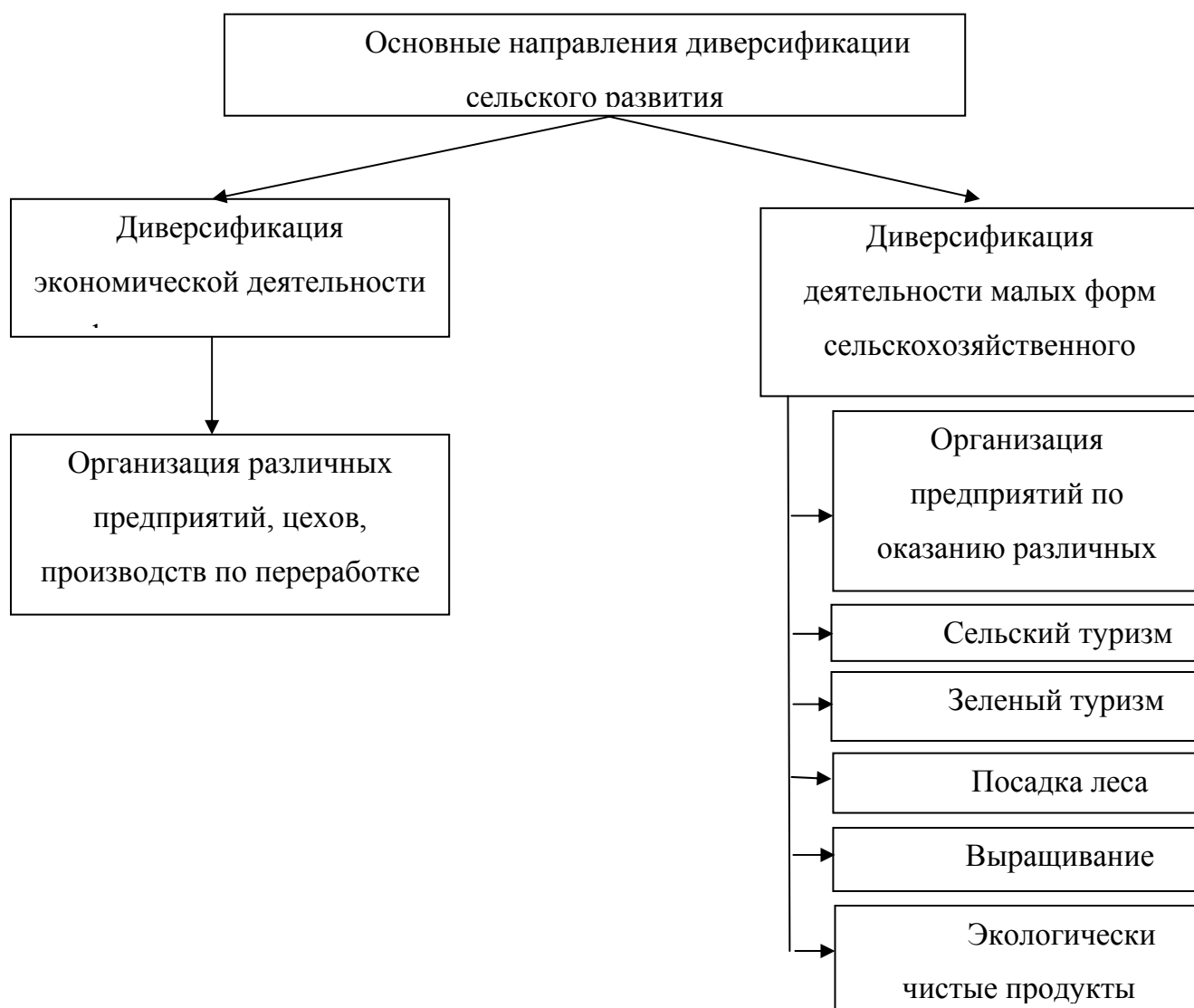
Рис. 2 – Основные направления диверсификации

Одним из таких направлений на наш взгляд, может быть использование принципа диверсификации сельскохозяйственного производства (рис. 2) [2].