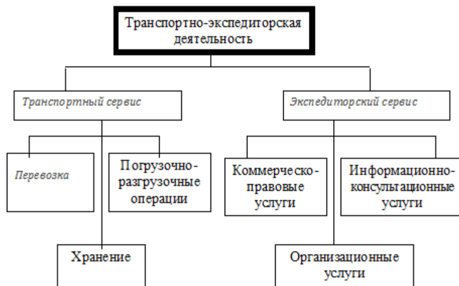
Рис. 1- Виды транспортных и экспедиторских услуг в логистической системе транспортно-экспедиторской деятельности в процессе распределения товаров

На рис.1 показаны виды транспортных и экспедиторских услуг в логистической системе транспортно-экспедиторской деятельности в процессе распределения товаров.