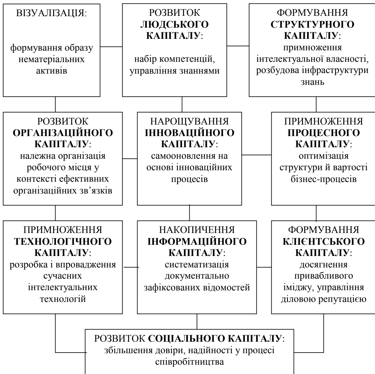
Рис. 3 – Синергетична система складових інтелектуального капіталу

Складові інтелектуального капіталу уособлюють інтеграційні сховища старих знань або мають потенціал генерації нових знань. Доповнюючи один одного, компоненти інтелектуального капіталу компанії формують її ціну у процесі комерціалізації. Таким чином, синергічний ефект може бути досягнутий за рахунок гармонійного сполучення і взаємозбагачення в єдиному механізмі складових інтелектуального капіталу (рисунок 3). Самоорганізація припускає наявність зв'язків між цими компонентами, які можуть не тільки перебудовуватися, але й виникати заново, вишукуючи шляхи найбільш адекватного пристосування до вимог мінливого середовища.