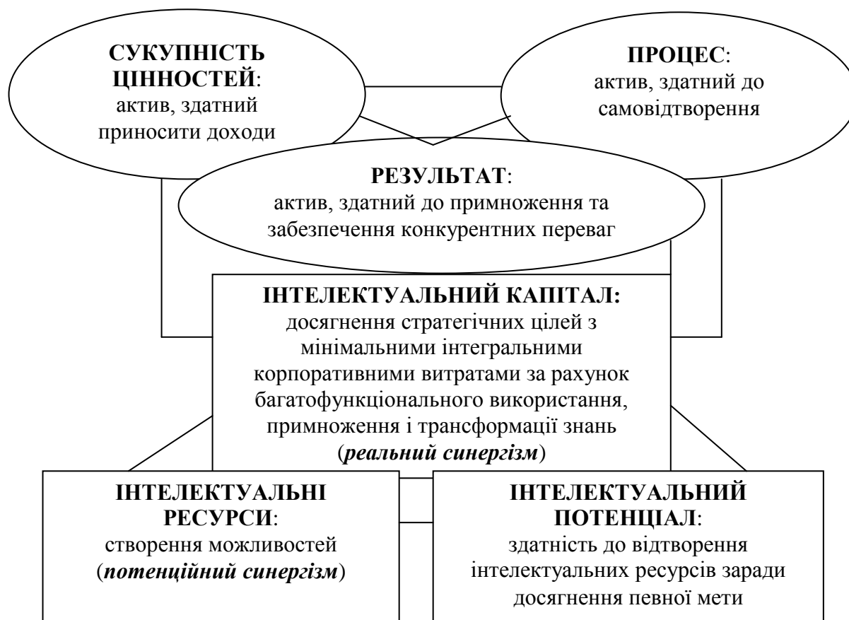
Рис. 2 – Взаємозв'язок інтелектуальних складових системи факторів сучасного виробництва (синергетична інтерпретація)

інтелектуальний капітал розглядається як актив, що володіє здатністю приносити доходи. З позиції процесу сутність інтелектуального капіталу полягає в його здатності до відтворення, у можливості залучення інтелектуального капіталу у процес кругообігу, в якому здійснюється його виробниче споживання. Сутність інтелектуального капіталу як результату полягає в його здатності до примноження та забезпечення конкурентних переваг суб'єкта. На нашу думку, комплексне трактування цієї економічної категорії дозволяє цілком розкрити її синергетичну природу (рисунок 2).