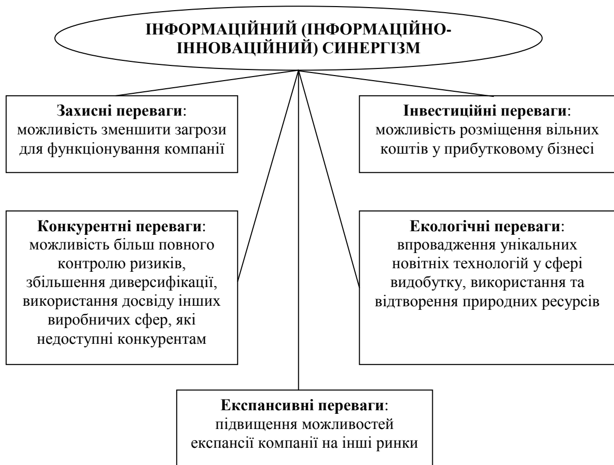
Рис. 4 – Основні групи переваг інформаційно-інноваційного синергізму інтелектуального капіталу

Об'єднання інформації з іншими видами ресурсів, а також з іншою інформацією, що дає більший ефект, ніж звичайне об'єднання окремих корисних ефектів від кожного ресурсу окремо, можна позначити терміном "інформаційний (інформаційно-інноваційний) синергізм". Основою цього ефекту є інформаційні активи, які в разі поєднання з іншими виробничими факторами надають комплекс переваг [11], які можна, у свою чергу, вважати проявами ефективного функціонування інтелектуального капіталу (рисунок 4).