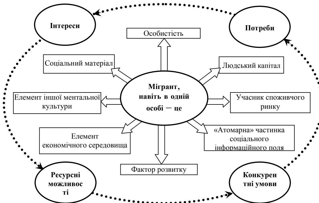
Рис. 2 – Модель ключових характеристик мігранта, що впливають на економіку і соціальний стан країн

саморозвитку, як учасник споживчого ринку, як елемент іншої ментальності і культури, як активний елемент екологічного середовища, як «атомарна» частинка соціального інформаційного поля (рис. 2).