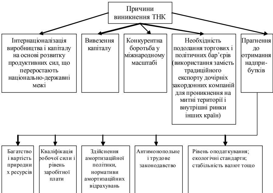
Рис. 1 - Причини активізації діяльності ТНК

Переваги корпорації, що пов'язані з транснаціоналізацією, є водночас причинами активного розвитку ТНК (рис. 1).