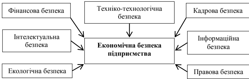
Рисунок – Функціональні складові економічної безпеки підприємства (узагальнено авторами на основі [1, 2]).

розширеного відтворення у довгостроковому періоді і у той же час є складовою частиною системи економічної безпеки на підприємстві. Формування інформаційно-аналітичного забезпечення економічної безпеки суб'єктів господарювання передбачає використання аналітичного інструментарію діагностики фінансового стану.