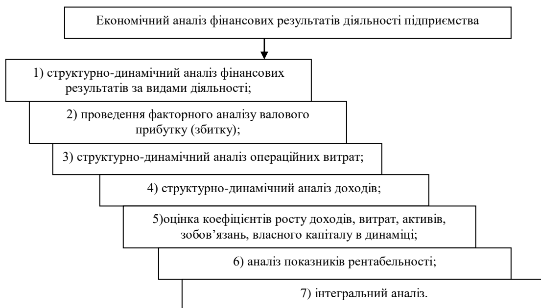
Рис. 1 – Алгоритм проведення аналізу фінансових результатів діяльності підприємства

Алгоритм проведення аналізу фінансових результатів представлено на рис. 1.