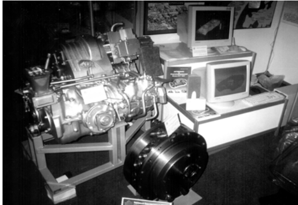
Рисунок 3 – Зразки гідрооб'ємно-механічних трансмісій, розроблених кафедрою спільно з ОАО „ХТЗ ім. С. Орджонікідзе” і ДП завод ім. Малишева

безступінчастих двопотокових гідрооб'ємно-механічних трансмісій автомобілів, тракторів, інших мобільних машин та транспортних засобів. Значними конкретними результатами в цьому напрямку є розробка оригінальних двопотокових ГОМТ для БТЛБ у експериментальному виробництві ОГКТ ХТЗ, модернізація механічної коробки передач БТЛБ шляхом синтезу гідрооб'ємного механізму повороту, участь у розрахунково-теоретичному обґрунтуванні гідрооб'ємного механізму повороту трактора ХТЗ-200, розрахунково-теоретична оцінка силових факторів у коробках зміни передач серійних тракторів та в трансмісії промислового трактора ТС-10.