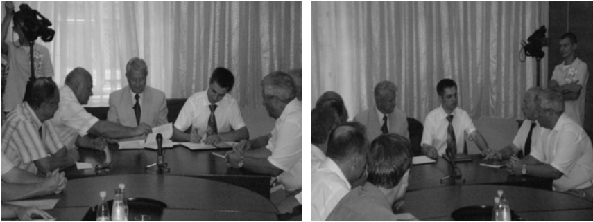
Рисунок 4 – Підписання договору між НТУ «ХПІ» і ВАТ «ХТЗ» про створення нового трактора з безступінчастою трансмісією

Мета проекту - наукове обґрунтування оптимальної схеми безступінчастої двопотокової гід्रोоб'ємно-механічної трансмісії для перспективного трактора ХТЗ потужністю 240 к.с., її автоматизоване проектування - випуск робочих креслень, створення бази покупних виробів, зборка трансмісії та її випробування на тракторі в польових умовах спільно з фахівцями заводу.