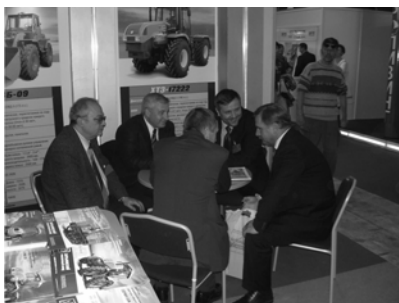
Рисунок 6 – Переговори керівництва ХТЗ з керівниками фірми «Фенд»