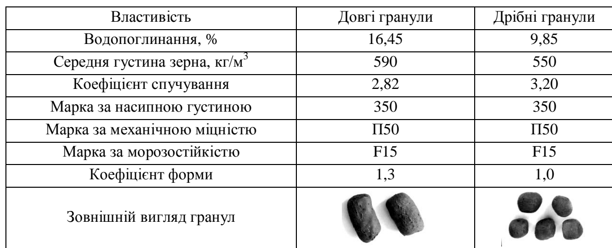
Таблиця 3 – Характеристика керамзитових гранул, отриманих за температури 1170 °С

З даних таблиці видно, що за умови дотримання визначених в дослідженні технологічних параметрів на основі слабоспучуваної глини з добавкою 1 % мазуту при використанні екструзійного способу формування можна отримувати керамзит різних розмірів з нормативними значеннями технічних властивостей, в тому числі необхідним коефіцієнтом форми.