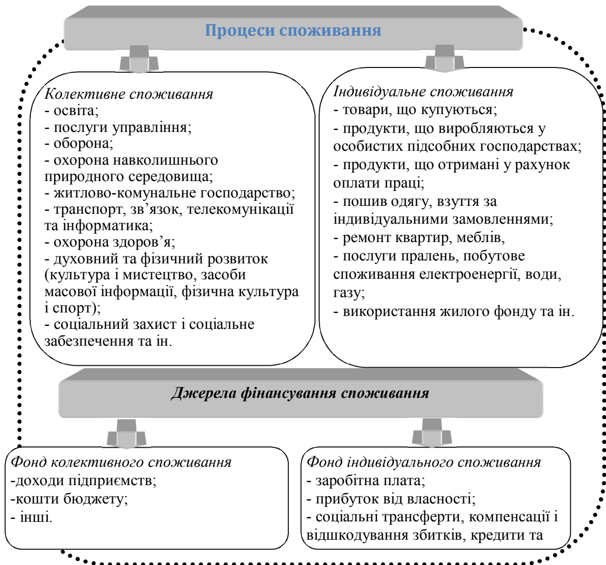
Рис. 1 – Джерела фінансування процесів споживання

підсобних господарствах, продукти, що отримані у рахунок оплати праці, пошив одягу, взуття за індивідуальними замовленнями, ремонт квартир, меблів, послуги пралень, побутове споживання електроенергії, води, газу, знос жилого фонду та ін. Джерелами фінансування фонду індивідуального споживання є заробітна плата, прибуток від власності, пенсії, допомоги, стипендії, компенсації і відшкодування збитків. Наголосити, що проміжне споживання підпорядковується виробничій логіці, а відтак є більш стабільним та прогнозованим у порівнянні із кінцевим споживанням. Кінцеве споживання прямо і опосередковано підпорядковується суб'єктивним перевагам індивідів.