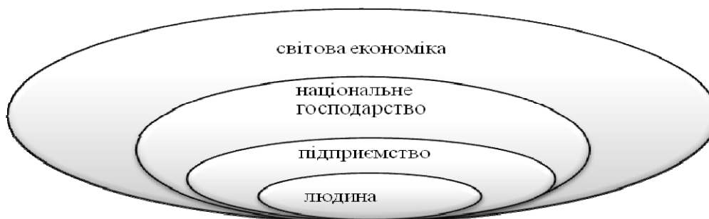
Рис. 1. Місце підприємства у світовій економіці.

Суспільні зусилля глобального масштабу нічого не варті без погодження окремих складових світової економіки. Підприємство виступає такою складовою, від якої залежить ефективно функціонування всієї глобальної економічної системи (див. рис. 1).