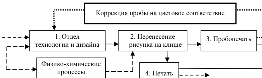
Рис. 1. Общая схема печатного производства

Общая схема печатного производства [6] представлена на рис. 1. Как видно из схемы, основная часть предпечатной обработки цветовой информации выполняется в отделе технологии и дизайна (ОТД), а основные проблемы цветопередачи возникают на участках 1, 3.