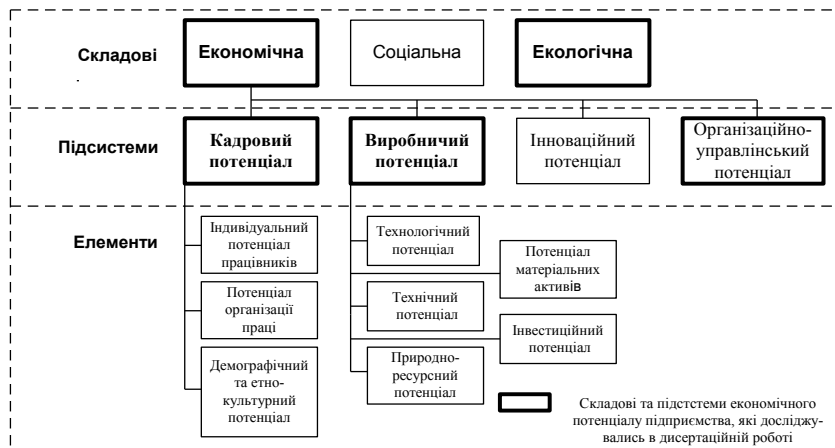
Рис. 1. Структура економічного потенціалу підприємства

і послуг в умовах, що забезпечують найбільш ефективне використання за часом і продуктивністю наявних економічних ресурсів. Доведено, що економічний потенціал підприємства є складною, динамічною, ієрархічною і, виходячи з характеру взаємозв'язків, стохастичною системою, що складається з підсистем і елементів (рис. 1, табл. 2). Кожна із підсистем економічного потенціалу залежить від оптимального поєднання окремих видів економічних ресурсів, які залучаються у виробничий процес, рівня організації виробництва, ефективності системи управління.