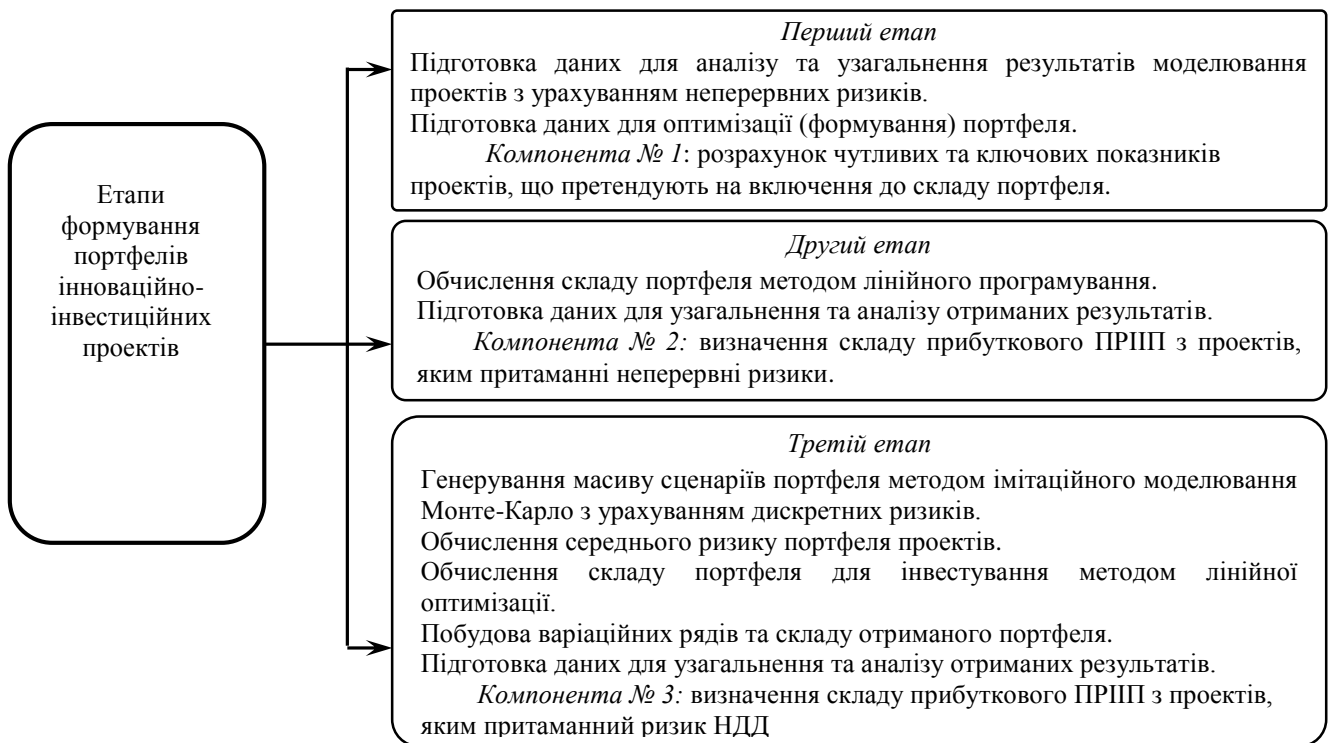
Рис. 1. Етапи формування ПРИП

– компонента № 2 – з використанням лінійного програмування виконується подальша оптимізація портфеля із застосуванням результатів, отриманих за допомогою компоненти № 1. Така послідовність компонент є застосовною за умови, що інноваційна ідея принципово відбулася, тобто має місце перелік проектів, яким притаманні неперервні ризики.