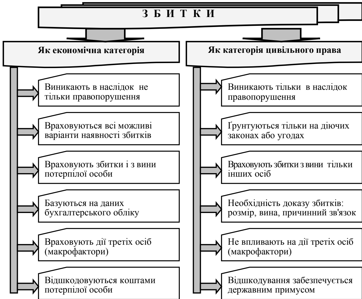
Рисунок 2 – Характерні риси збитків як економічної і юридичної категорії

втрата та упущена вигода), але і особі: моральні страждання, психологічна неврівноваженість тощо. Доведено дискусійність існуючої думки про те, що втрата ділової репутації відноситься тільки до терміну «школа» і не входить в поняття «збитки». Виявлено, що в бізнес-середовищі ділова репутація (гудвіл) є надзвичайно важливим активом, який формує реальні прибутки правовласників і визначає упущену вигоду при втраті частини гудвілу.