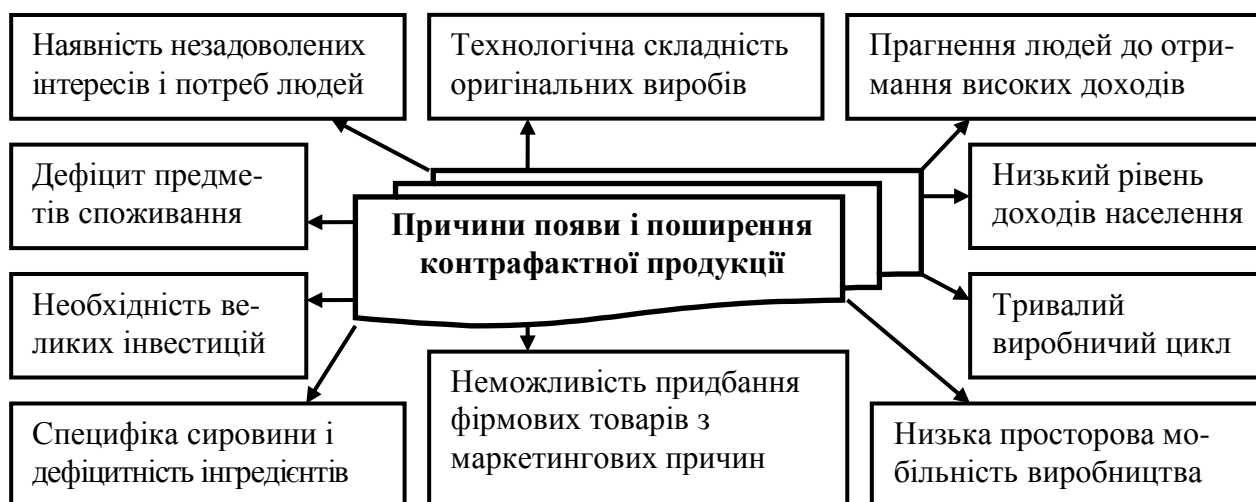
Рисунок 1 – Основні причини виробництва і широкої дистрибуції контрафактної продукції

Запропоновано поняття «контрафакт» визначати як товари, виготовлення, продаж, будь-яке використання, імпорт, перевезення чи зберігання яких призводить до порушення виключного права на результат інтелектуальної діяльності або засіб індивідуалізації, що виражені в даних товарах. Таким чином, головною і ключовою відзнакою контрафактної продукції від неконтрафактної є саме дані про порушення інтелектуальних прав. Визначення контрафактності товарів знаходиться в економіко-правовій сфері і не має прямого відношення до якості або ціни товару (проте, як правило, контрафактні товари мають більш низьку якість і ціну). Поява і поширення на ринку контрафакту, зумовлена низкою об'єктивних причин (рис.1).