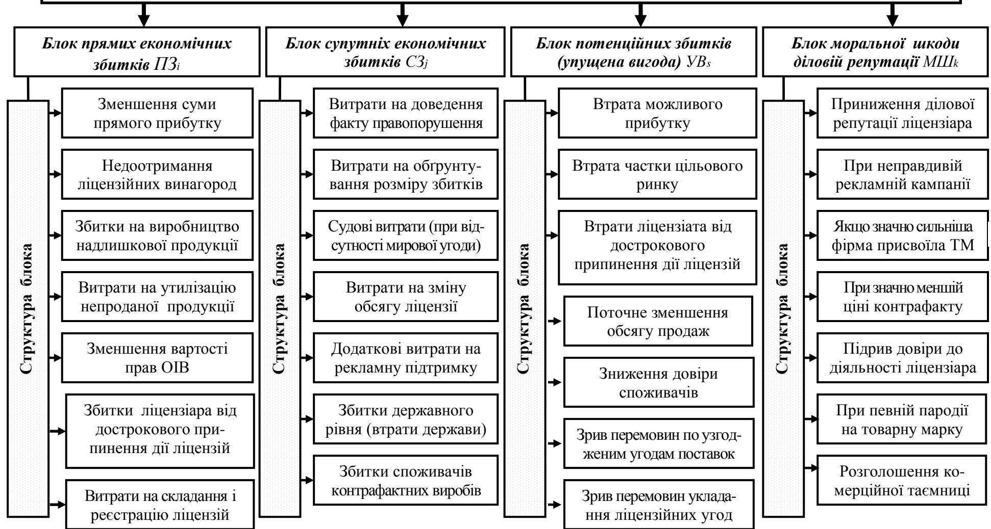
Рисунок 5 – Блочно-структурний підхід до формування збитків від порушення виключних прав правовласників виробниками контрафактної продукції