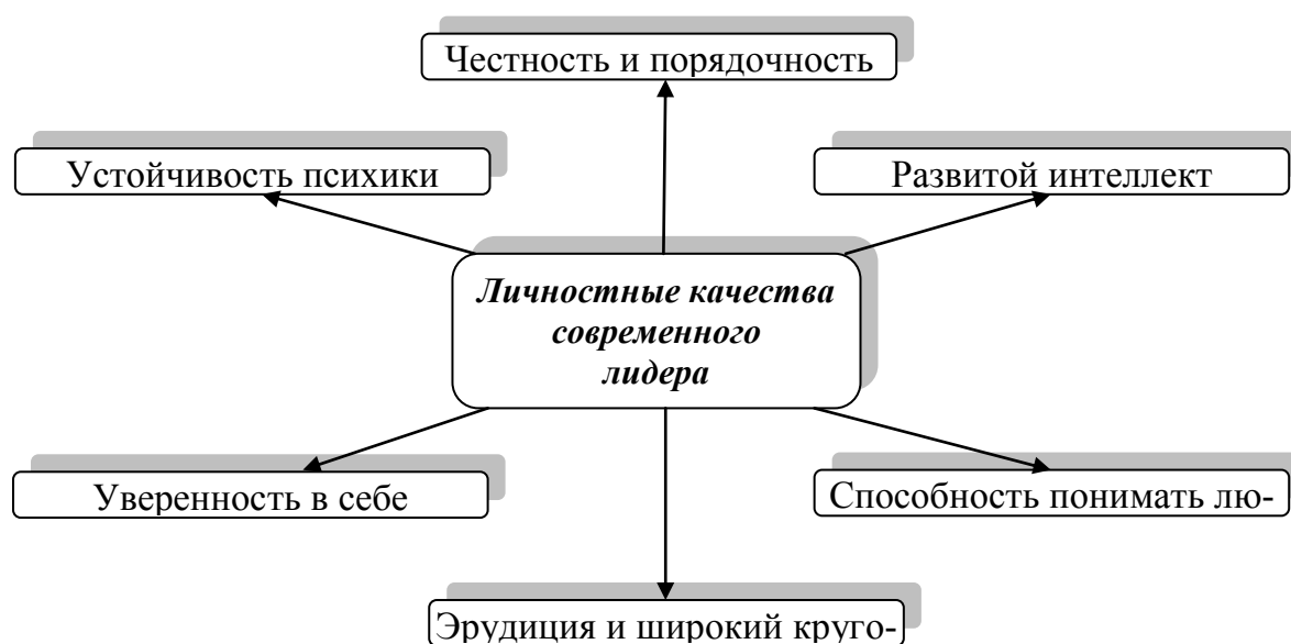
Рисунок 1. – Качества, необходимые современному лидеру

Личностными качествами, крайне необходимыми успешному современному лидеру, должны быть следующие (рис. 1):