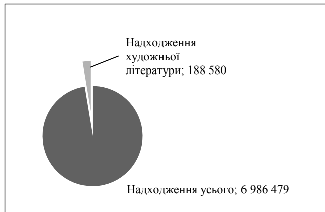
Рисунок 3 – Сегмент художньої літератури у надходженнях до фондів бібліотек м. Харкова

Якщо ж оперувати статистикою книговидання за останні роки [2], то можемо зробити висновок, що із тиражу художньої літератури 2011 р. (9 228 500 прим., 3 731 назва) до бібліотек, включених у наше дослідження, надійшло 18 660 прим. (0,2%).