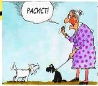
Закон Годвіна або

Якщо в питанні анкети передбачається лише два варіанти відповіді «так» або «ні», найчастіше респонденти виберуть негативний варіант. У соціології дане явище одержало назву закон Беттеріджа, названий на честь британського журналіста Мерфі Беттеріджа, він першим визначив, що суспільною думкою можна маніпулювати прямо під час опитування. Наприклад: «Чи наступить завтра кінець світу?», «Чи знайдено ліки від раку?».