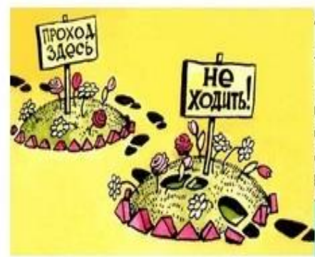
Закон Беттеріджа або