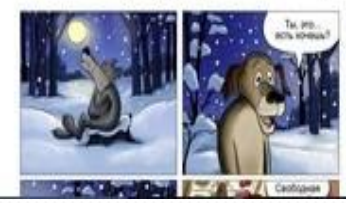
Закон Хотеллінга або

ймовірність згадування нацистів або Гітлера наблизиться до одиниці, тобто 100%». Інакше кажучи, чим довше обмін коментарями, тим більше шансів, що один з опонентів приведе порівняння з Гітлером як вирішальний аргумент.