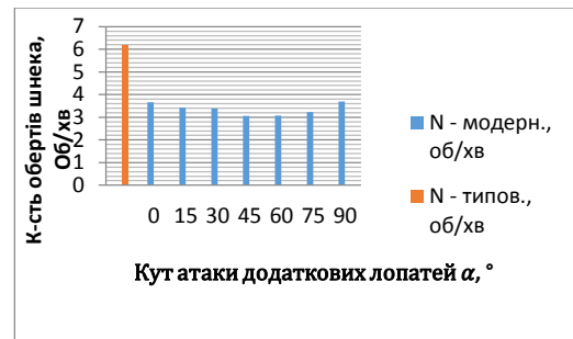
Рис. 5 – Гістограма розподілення критичних частот обертання шнеків модернізованої та класичної конструкції

На рис. 5 приведено порівняльний аналіз критичних частот обертання шнекового конвеєру з додатковими лопатями та з класичною конструкцією.