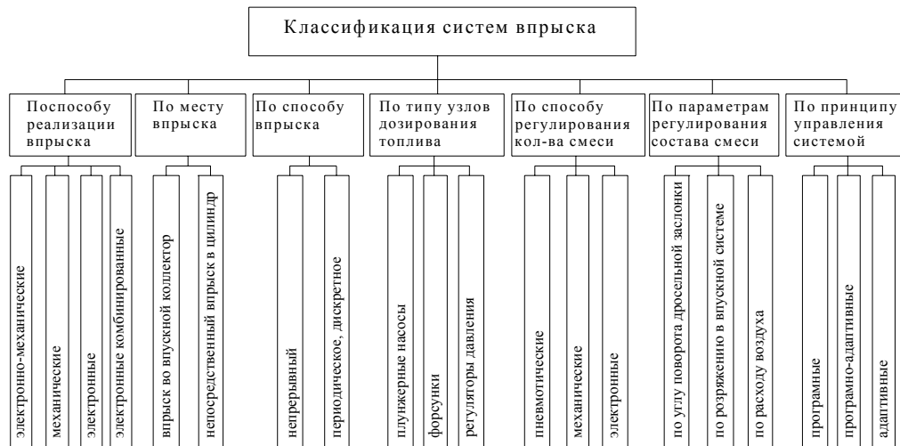
Рисунок 1 – Классификация систем впрыска

Сейчас в мире разрабатывается и серийно выпускается большое количество систем управления двигателями. Эти системы по принципу действия имеют много общего, но и существенным образом отличаются. В связи с этим автором выполнен анализ некоторых комплексных систем управления и составлена их классификация (рис. 1).