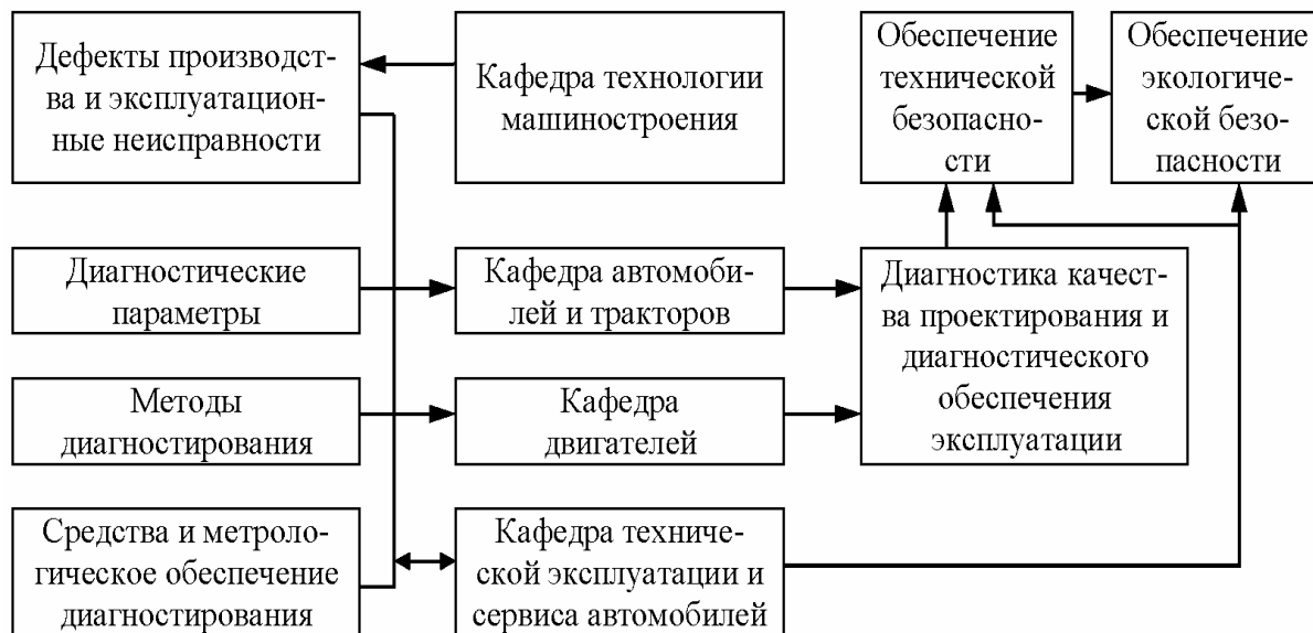
Рисунок 2 – Схема организации лекционного курса