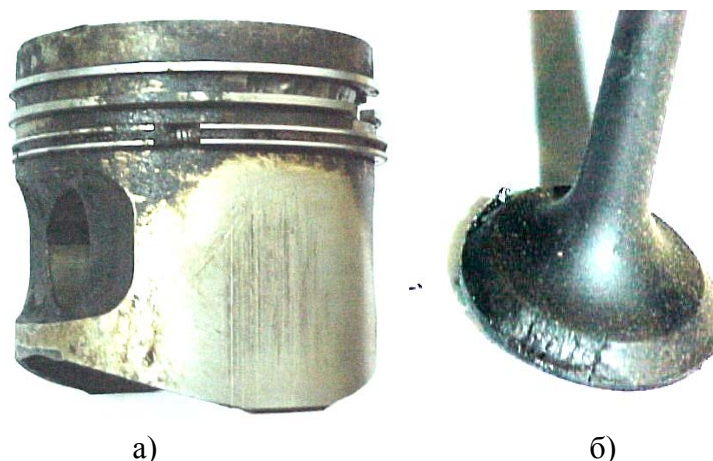
Рисунок 3 – Несправності деталей, що забезпечують герметичність камери згоряння двигуна: а) залягання поршневих кілець, деформація й злам поршневих перегородок, прогар поршня, б) прогар головки клапана

У процесі експерименту виявлені типові порушення герметичності камери згоряння і визначені відповідні значення діагностичних параметрів (рис. 3). Так, наприклад, при прогару поршня, деформації й зламі поршневих перегородок, заляганні поршневих кілець спостерігається падіння компресії в несправному циліндрі стосовно справного й пульсуюче підвищення тиску картерних газів. При порушенні герметичності клапана внаслідок прогару головки або деформації стержня відбувається падіння компресії в несправному циліндрі без підвищення тиску картерних газів.