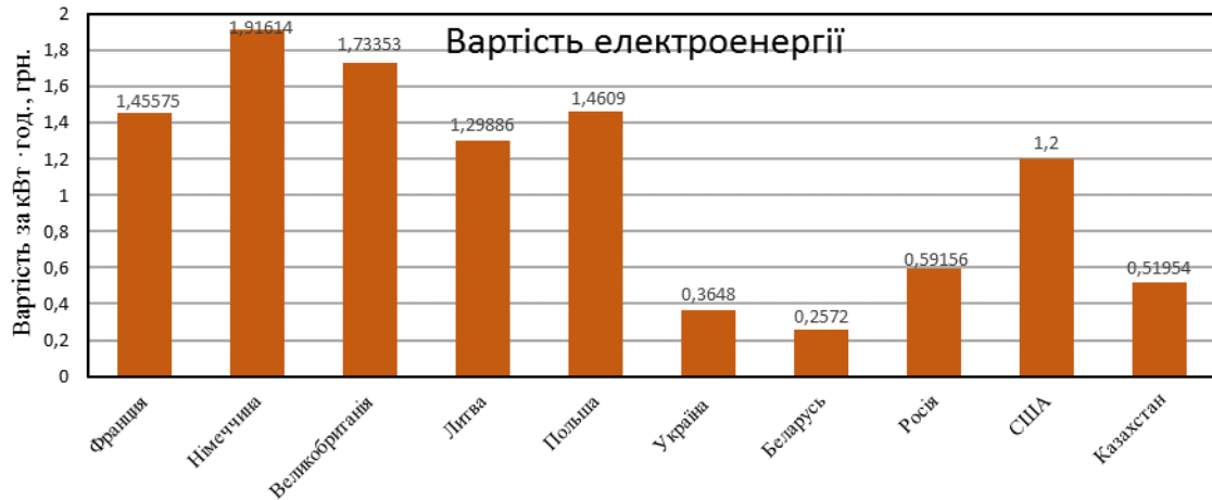
Рисунок 2 – Тарифи на електричну енергію в різних країнах

На рис. 2 представлена інформація про тарифи на електричну енергію для в тих же самих країнах в перерахунку на грн. за 1 кВт·год. [6].